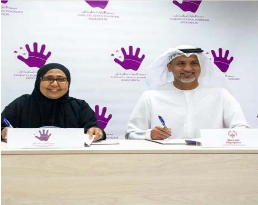
مؤسسة الأولبياد الخاص الإماراتي