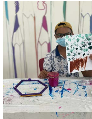
ورش الرسم وإعادة التدوير