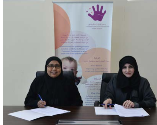
مكتب المنصة للاستشارات القانونية