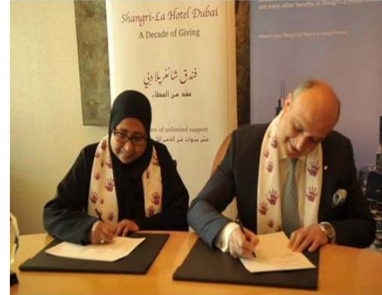
تجديد مذكرة التفاهم مع فندق شانغريلا