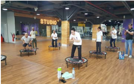
البولينج / السلة