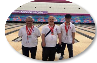
المشاركة في الملتقى الأول للأولمبياد الخاص الإماراتي البولنج