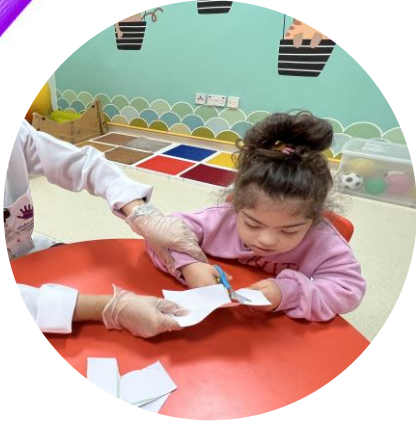
جلسات علاج اضطرابات اللغة والكلام