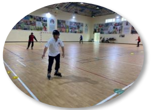
تجارب مسابقة التزلج المدولب مع الأولمبياد الخاص الإماراتي