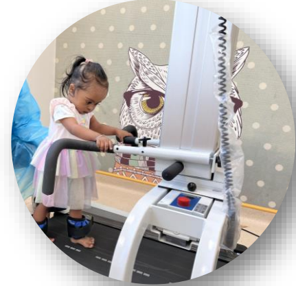
جلسات العلاج الطبيعي