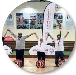
المشاركة في الملتقى الرابع للأولمبياد الخاص الإماراتي البوتشي