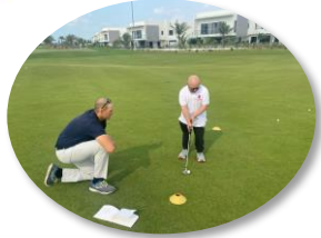
مهرجان الجولف الموحد مع الأولمبياد الخاص الإماراتي

الحصول على 5 ميداليات 2 ذهبية 2 فضية 1 برونزية