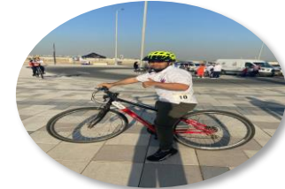
مسابقة الدراجات الهوائية مع الأولمبياد الخاص الإماراتي