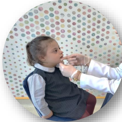
جلسات العلاج الوظيفي