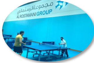
بطولة فردي الرجال الاولي لكرة الطاولة بالتعاون مع اتحاد كرة الطاولة والأولمبياد الخاص الإماراتي