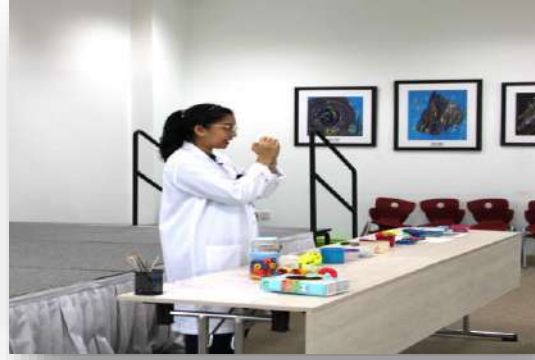
ورشة تعريفية للأسر عن العلاج الوظيفي