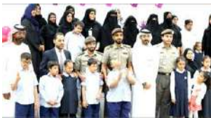
يوم المرأة العالمي