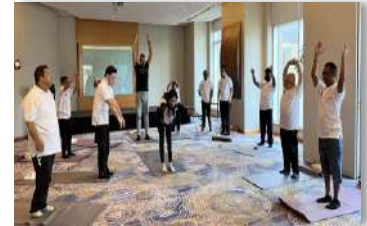
مبادرة لياقة بدنية بالتعاون مع فندق شانغريلا