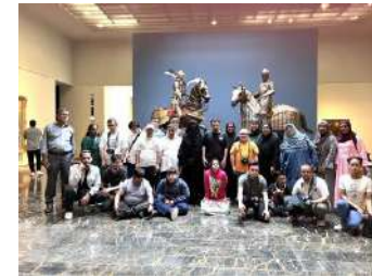
زيارة متحف اللوفر