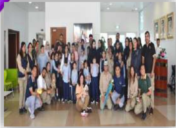
فعالية بالتعاون مع سفاري دبي