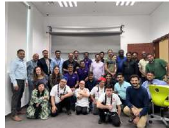
زيارة شركة هنكل