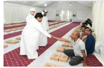
فعالية إفطار صائم بالتعاون مع الإدارة العامة للإقامة وشؤون الأجانب