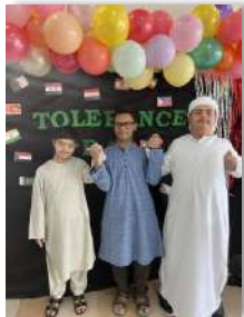
اليوم العالمي للتسامح