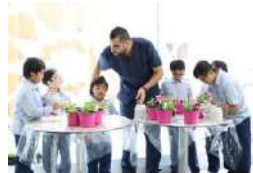
ورشة زراعية تثقيفية بالتعاون مع بلدية دبي