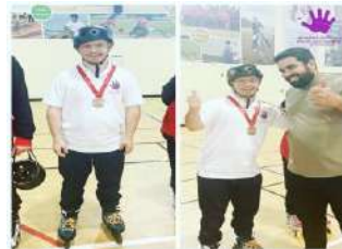
تجارب مسابقة التزلج المدولب مع الأولمبياد الخاص الإماراتي