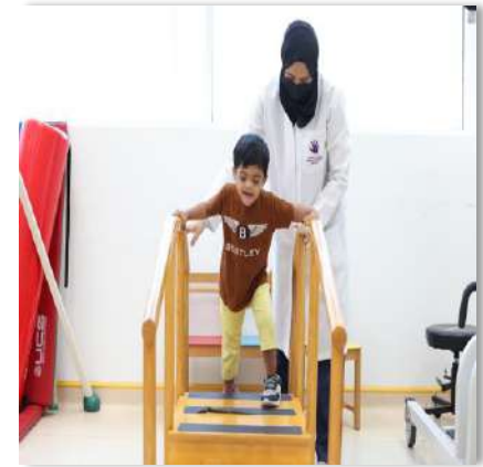
جلسات العلاج الطبيعي