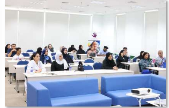
الاجتماع السنوي مع أولياء الأمور