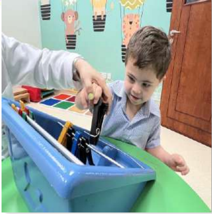
5- التربية الخاصة