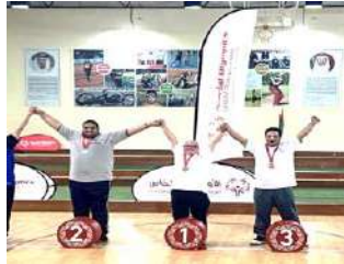
المشاركة في الملتقى الرياضي للأولمبياد الخاص الإماراتي- البوشي

الحصول على 5 ميداليات 2 ذهبية 2 فضية 1 برونزية