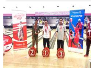
المشاركة في الملتقى الأول للأولمبياد الخاص الإماراتي البولينيغ