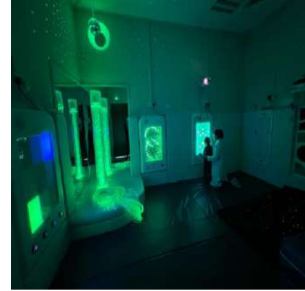
3- التكامل الحسي