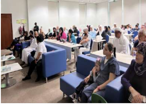
محاضرة التغذية السليمة نحو سلوك غذائي صحي