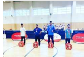
بطولة فردي الرجال الاولي لكرة الطاولة بالتعاون مع اتحاد كرة الطاولة والأولمبياد الخاص الإماراتي