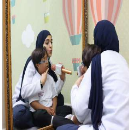
جلسات العلاج الوظيفي